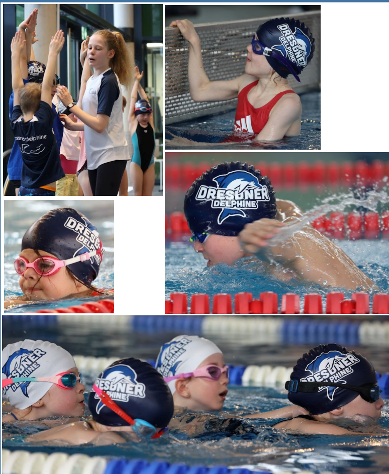
Klein – Aber Fein!