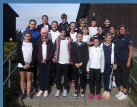
Trainingslager Herbst 2023