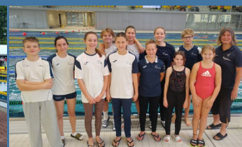
Wettkampf in Dresden 2023