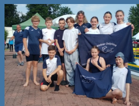
Teilnahme in Enns 2023